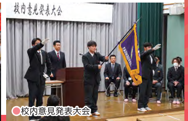
● 校内意見発表大会