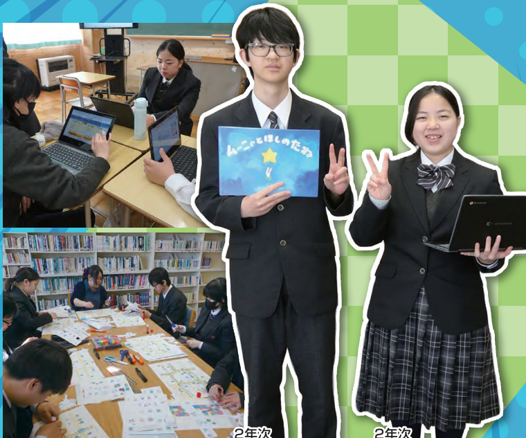
2年次 (剣淵町立剣淵中学校出身)