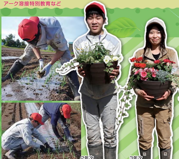
2年次 (士別市立士別中学校出身)

日本農業技術検定・簿記検定・食品衛生責任者・ガス溶接技能講習・アーク溶接特別教育など