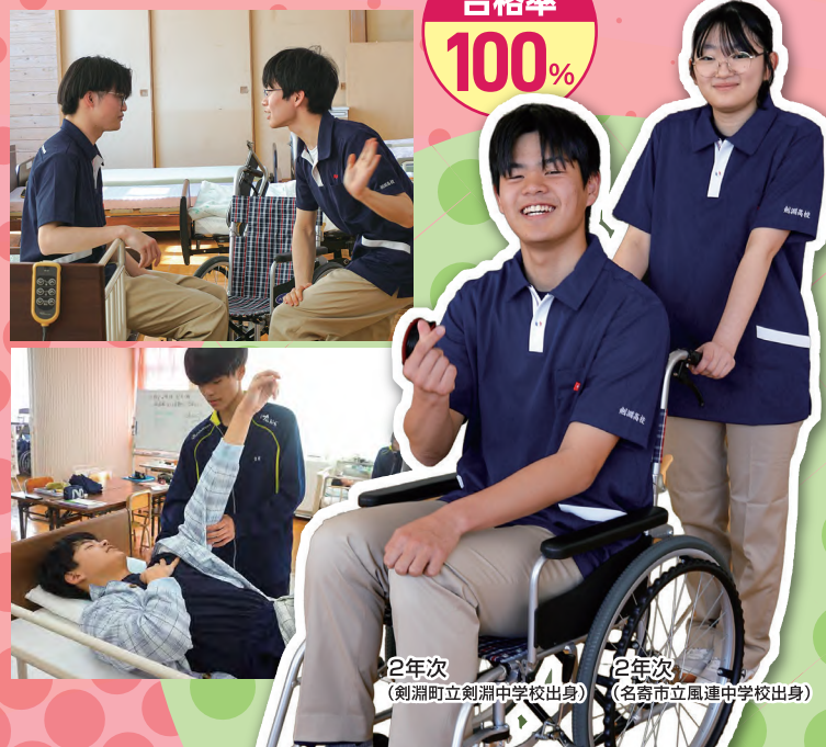
2年次 (剣淵町立剣淵中学校出身)