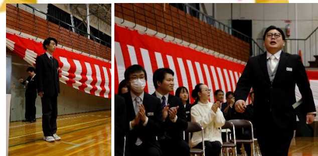
卒業生の入場です。