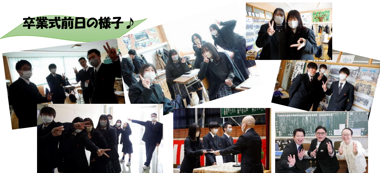
家庭学習期間を経て、1ヶ月ぶりの登校です。