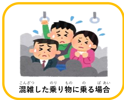
こんざつ のりもの ばあい 混雑した乗り物に乗る場合

ただし、つぎ ばあい ちやくよう すいしやう ただし、次のような場合は、マスクの着用が推奨されます。