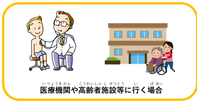
いりようきかん こうれいしゃしせつとう ばあい 医療機関や高齢者施設等に行く場合